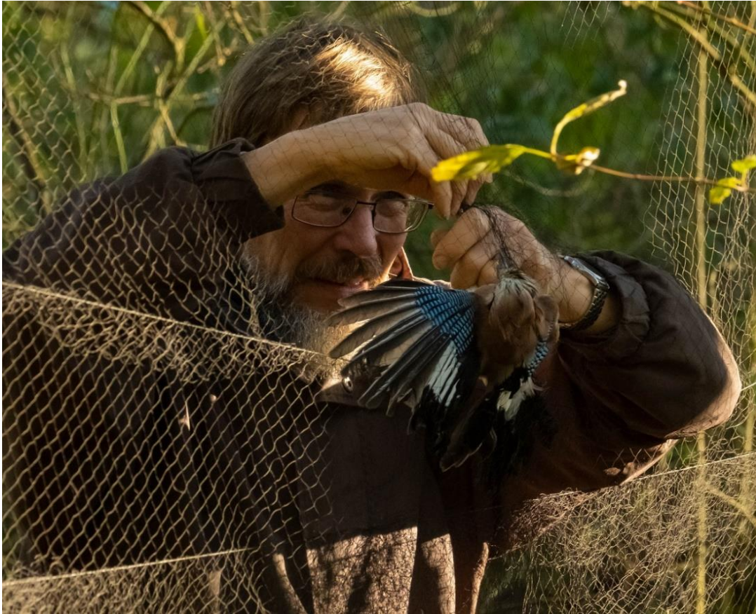
Gaai in net