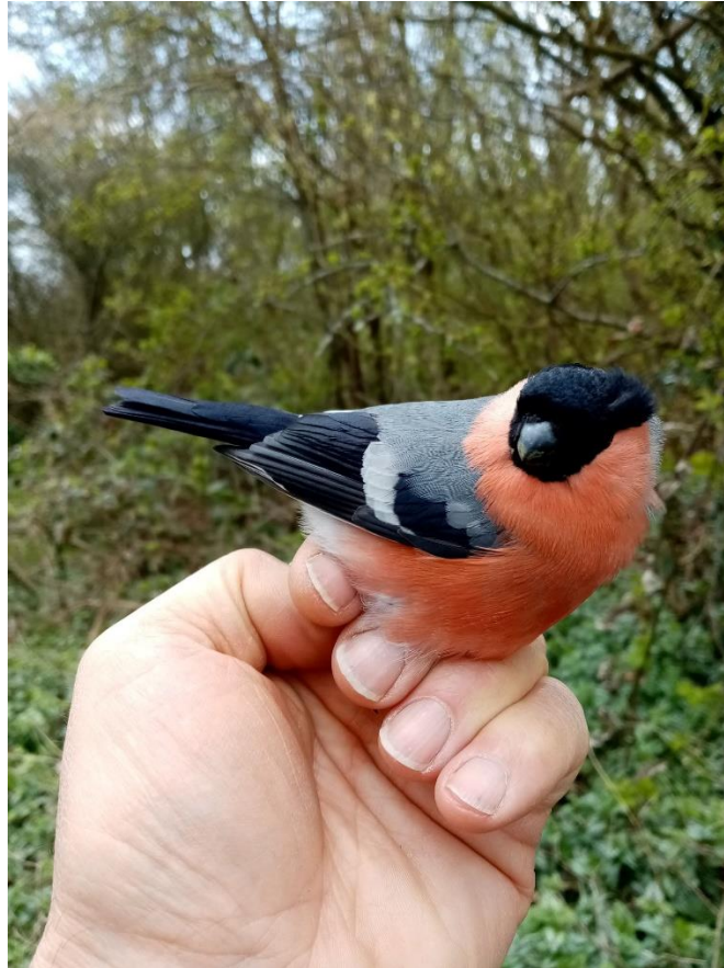
Noordse Goudvink man

Donderdag ochtend op tijd, eindelijk rust in de atmosfeer, toch bescheiden: 1 Fitis , 4 Roodborsten en van alles een enkeling (11 geringd). Zaterdag ook 11 geringd, weinig bijzonders, al is een Zwartkop terug uit april (!) 2016 natuurlijk wel de moeite.