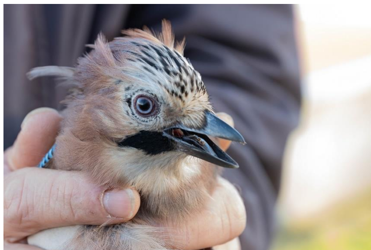
Gaai, liefst 7 geringd dit jaar