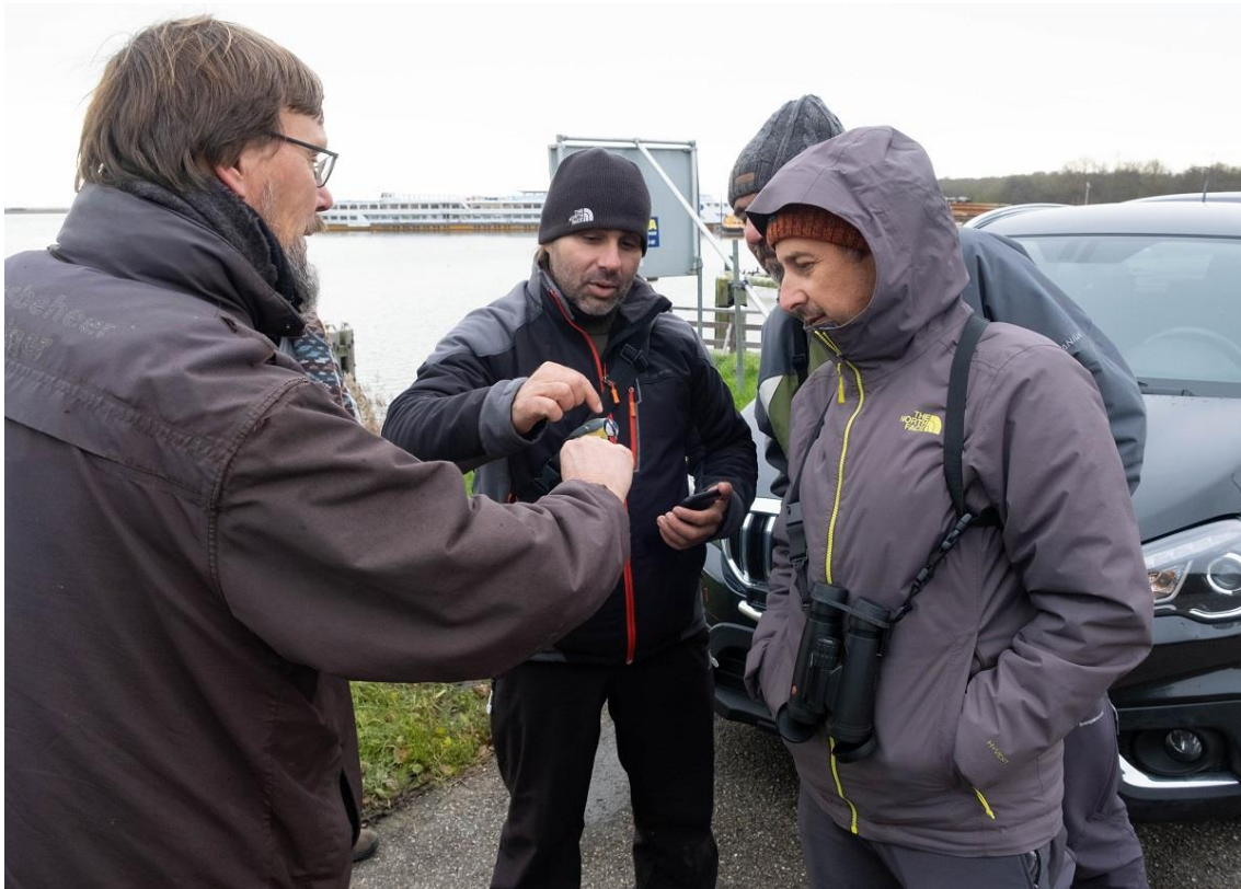
Vogelaars uit zuid Spanje die toevallig te gast waren. Man in het midden is zelf ringer.

Gecontroleerd: 13 april 2021 als man 2 kj, Leemans, 58 km