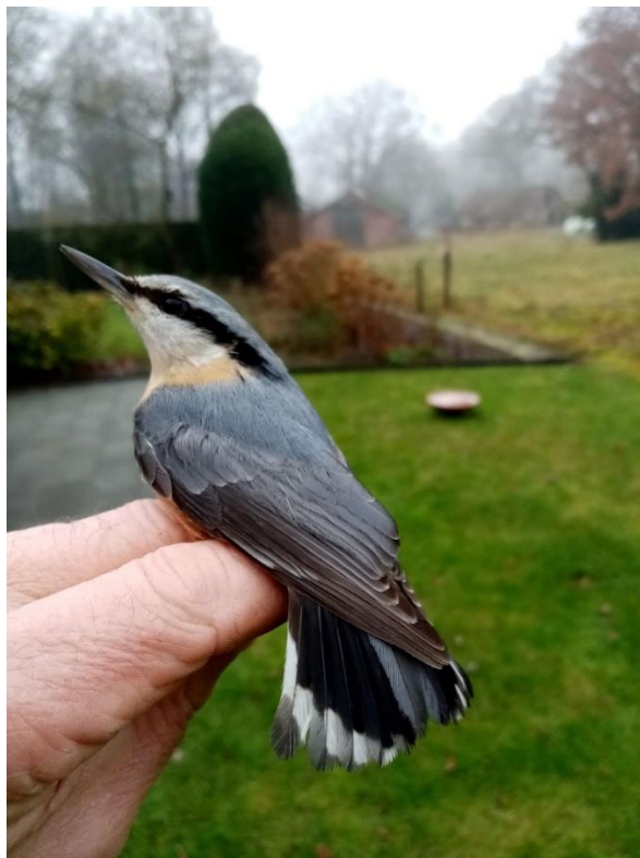
Mijn eerste Boomklever