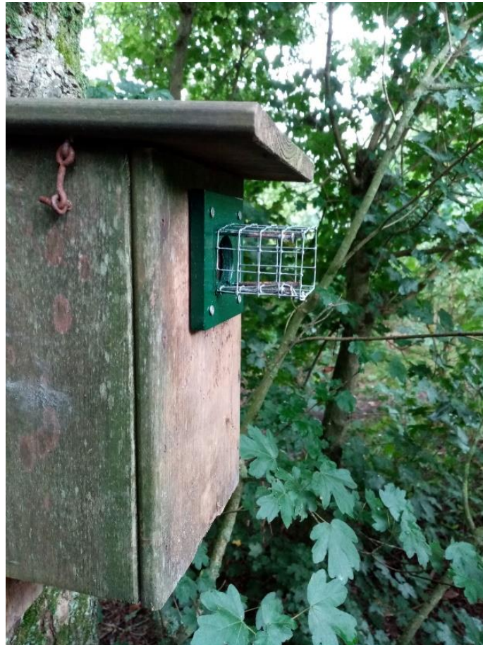
Anti marter maatregel