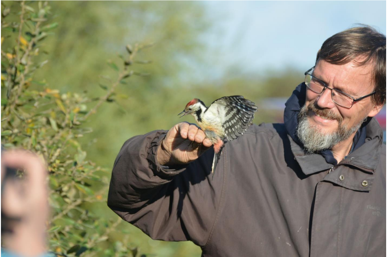
Middelste bonte specht, nieuw voor Wierhaven werkgebied

Maandag weer terug naar normaal: 2 Goudhaantjes , 3 Vuurgoudhaantjes en 2 Sijzen zijn weer leuk. Namiddag sessie 16/11 levert 2 Sijzen op, maar 2 Merels en slechts 5 van veel meer aanwezige Koperwieken . Nog zo eentje op 19 november: 2 Roodborsten , 1 Vuurgoudhaan , 11 Merels , 1 Koperwiek , 2 Vinken en 9 Sijzen . Dik de moeite.