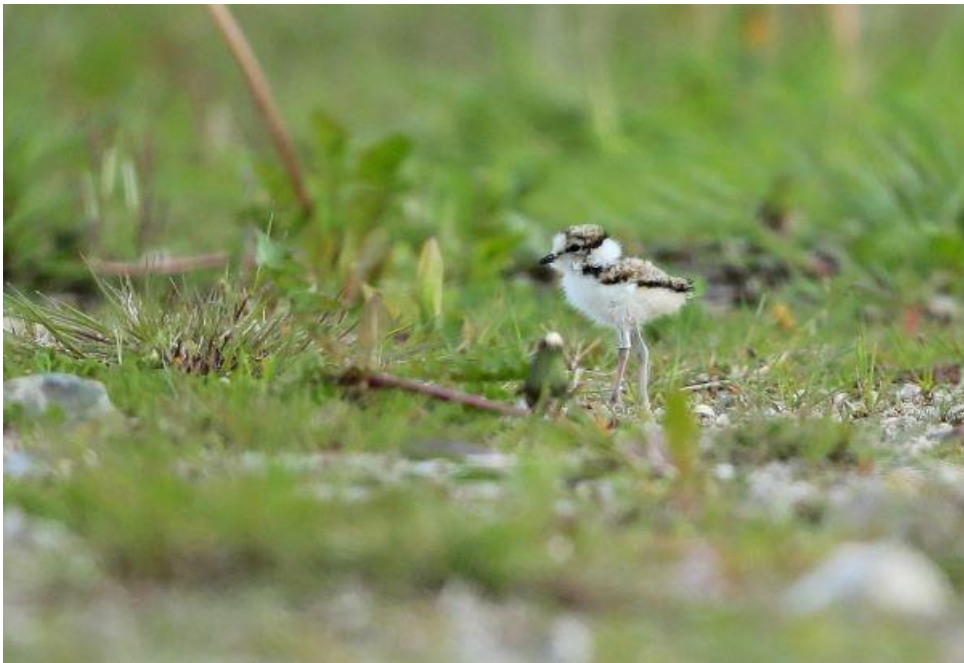
Kleine plevier pul

We lopen ongeveer 140 mezenpullen achter vergeleken met vorig jaar, maar er komen er nog wel flink wat; laat dus.