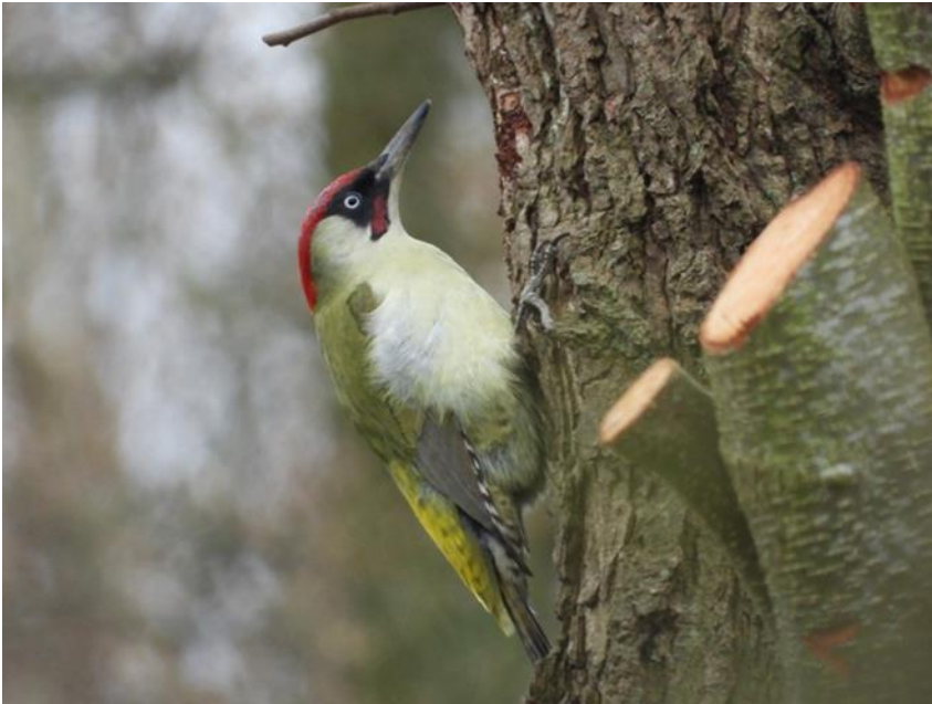
Groene specht

geen vogels en kwam ik niet verder dan buizerd als je me vroeg om een roofvogel te noemen. Je moet je ogen openen om vogels te kunnen zien en ik ben heel blij dat ik daar nu van kan genieten. Waarschijnlijk zie ik nog steeds veel minder dan andere doorgewinterde vogelaars, maar het begin is er.