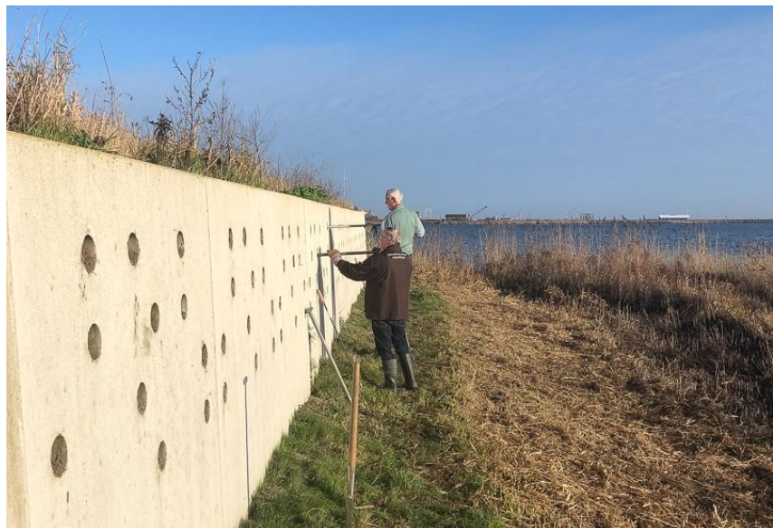
Tellers in actie

Daarbij heb ik gevraagd of we in contact kunnen komen met een oeverzwaluwdeskundige / onderzoeker. Tot op heden nog geen antwoord.