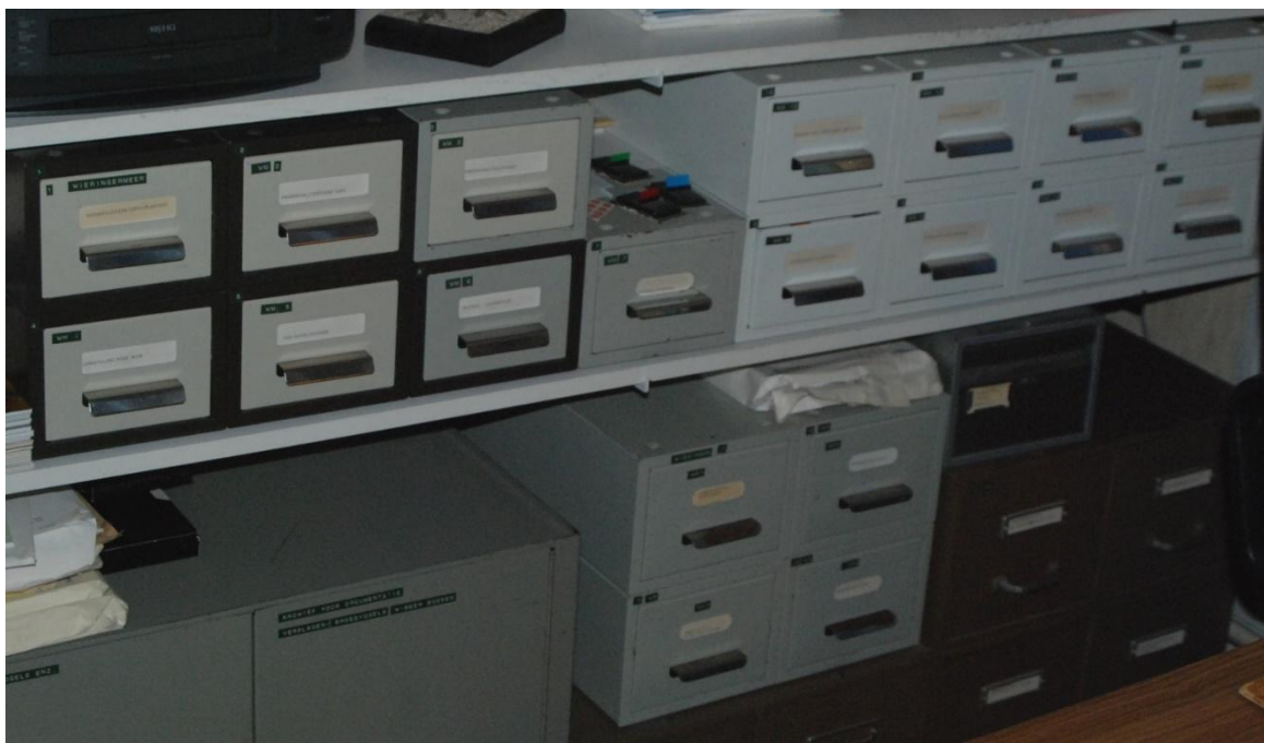
Een deel van het archief bij de archivaris

Er waren nog ander tijdschriften en publicaties die gegevens over vogels publiceerde. Nadat de naam van de Vogelwacht Wieringermeer was omgezet in KNNV Vogelwerkgroep Wieringen en Wieringermeer vond het bestuur destijds dat waarnemingen uit ons werkgebied in een archief dienden te komen. De archiefbewaarder werd Otto de Vries. Daartoe kochten wij archiefdozen en maakten kaartjes met een aantal zaken die van belang waren. In totaal zijn er 15 dozen met ongeveer 16.000 waarnemingen uit de Wieringermeer, 8 kaartenbakken voor Wieringen en 1 voor Medemblik. Verder is er een halve kaartenbak voor zoogdieren. Het aantal waarnemingen is natuurlijk gigantisch. De laatste kaartjes kwamen in 2003. Daarna ging alles digitaal via Waarneming.nl. De website van Wierhaven is hieraan gekoppeld.