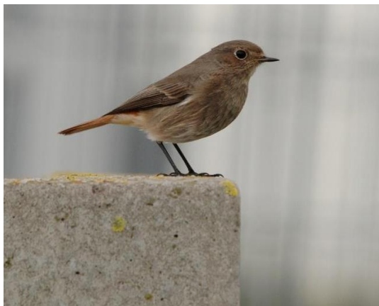
Zwarte roodstaart

In 1985 meldt Luc Smit dat er twee broedsels hier zijn grootgebracht. In de jaren