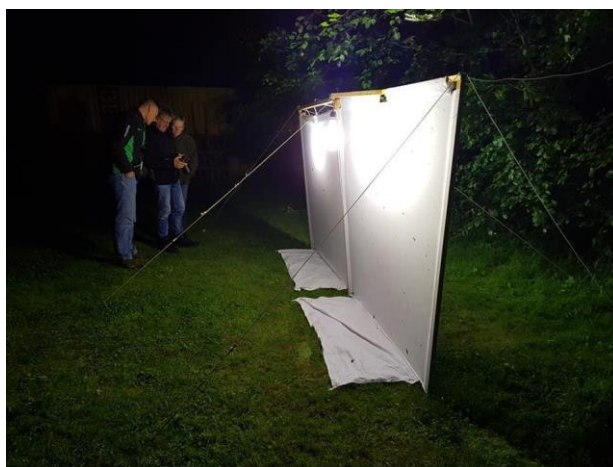
Nacht van de Nachtvlinder