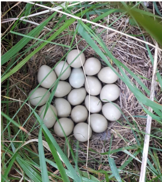
Een patrijzennest.

Het is natuurlijk prachtig als er zoveel territoria van de patrijs in kaart zijn gebracht,