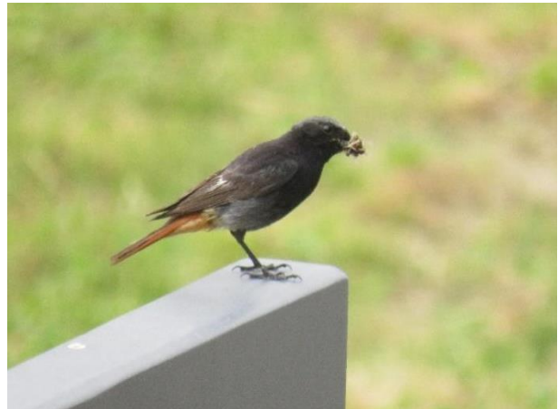
Zwarte roodstaart

Tussen 2004 en 2019 heb ik de soort 53 keer waargenomen. De meeste waarnemingen beginnen in april, maar in 2009 zong een vogel op 28 maart. De laatste waarneming in deze jaren is op 28 oktober 2008.