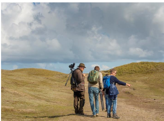
Excursie naar Texel

Hieronder vinden jullie een impressie van onze excursies.