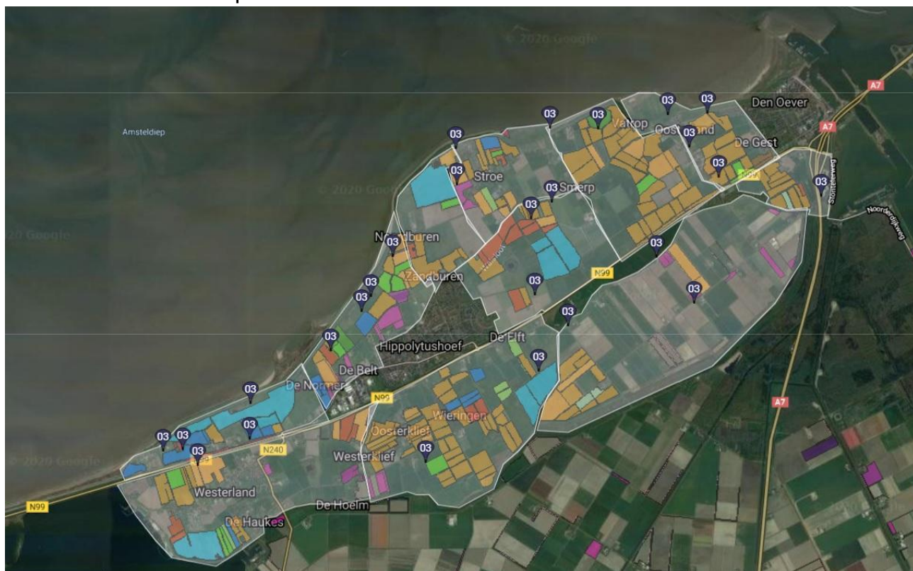
Een overzicht van de patrijzen paartjes op Wieringen in 2020.

reageerde door terug te roepen. Een enkele keer kwam het mannetje zelfs op de vrijwilligers afvliegen, omdat hij dacht dat er een concurrent in zijn territorium aanwezig was. Maar lang niet alle vogels doen dat, zoals in de uitzending van Vroege Vogels TV was te zien. Buiten de data van de drie telrondes zijn nog aanvullende waarnemingen gedaan en is gebruik gemaakt van observaties via www.waarneming.nl . Want er wordt op en rond Wieringen door veel vogelaars gevogeld van Wierhaven en uit andere delen van Nederland. Veelal bevestigde dit vooral de resultaten van onze tellingen en voegde het slechts één extra broedpaar toe.