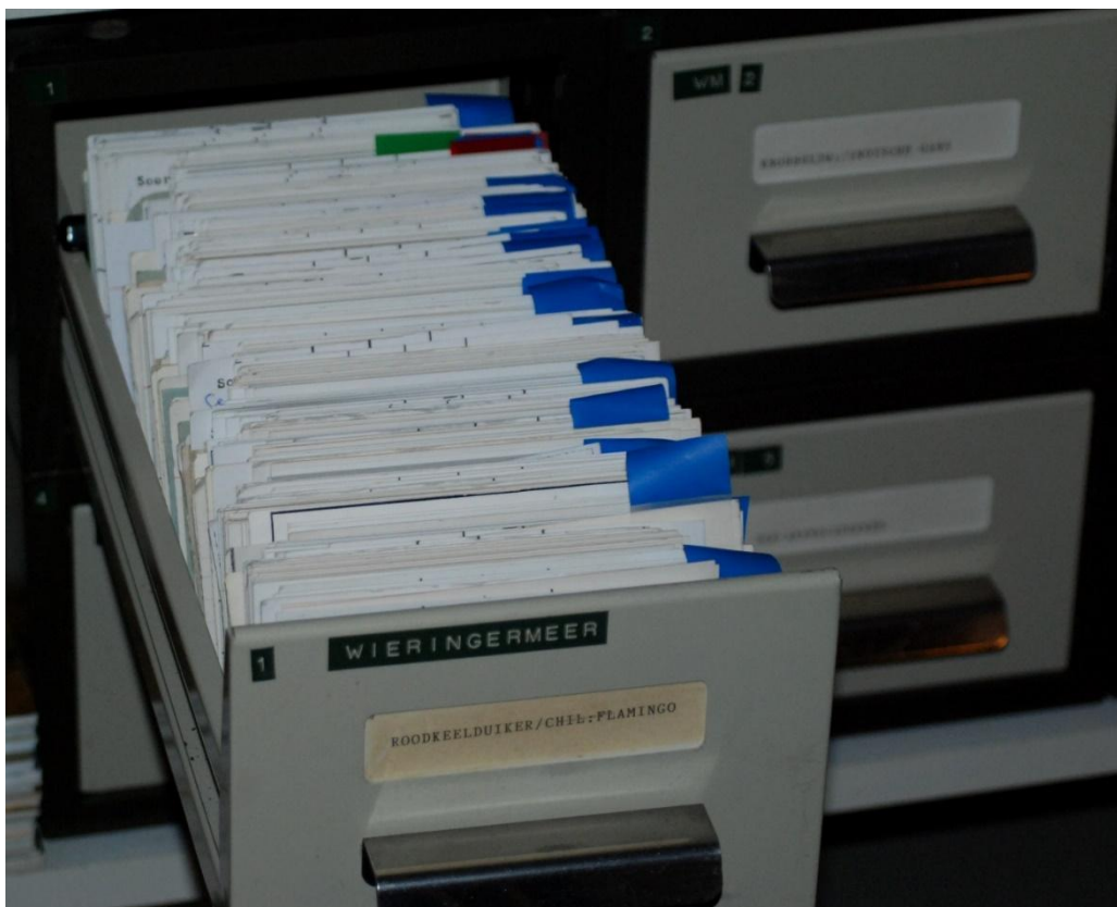
Eén van de kaartenbakken van de Wieringermeer

Ook was ik zelf diverse malen in Artis en op de kaartjes waar ik de waarnemingen die eerder waren gedaan, opschreef, staat dan bijvoorbeeld Art. (Artis). Er waren veel jaargangen van tijdschriften door te nemen. Zelf kon ik dat doen bij tijdschrift 'De Pieper' van de Vogelwerkgroep Noord-Hollands Noorderkwartier. Ook verzamelde ik zo artikelen over Wieringen en de Wieringermeer. Wie de vogelstand in ons werkgebied wil volgen, kan dus uit heel veel archiefwerk putten. Zie ook de Meerkoet special die in 2013 verscheen.