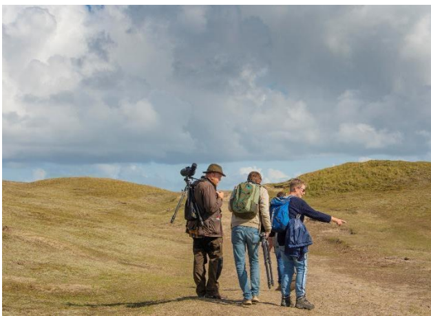
Excursie naar Texel

Hieronder vinden jullie een impressie van onze excursies.