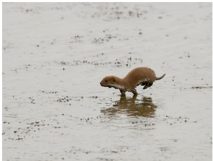
Een wezel op het schor

Toen ik aankwam was het laagwater. Veel vogels stonden in het slik hun kostje bij elkaar te scharrelen. Een eindje bij de meeuwen vandaan zag ik opeens iets lopen, maar ik kon niet onderscheiden wat het was. Het liep helemaal langs de vloedlijn en dat was best ver het wad op! Het diertje moest natuurlijk ook weer terugkomen naar de pier, tenminste dat was mijn vermoeden... Ik zocht een strategisch plekje op en ging erbij zitten om af te wachten wat er zou gebeuren.