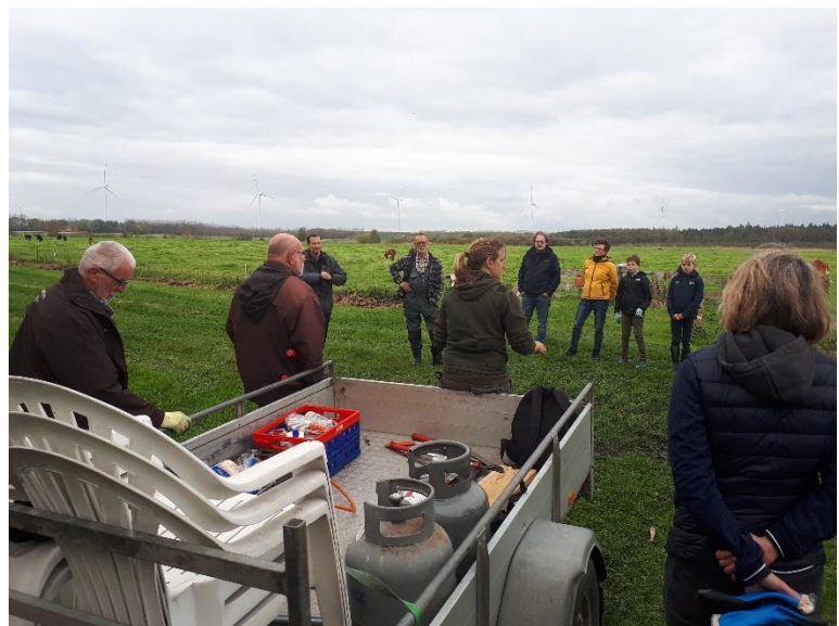
Deelnemers krijgen instructie van Staatsbosbeheer

Al snel was het een gezaag, geklop, gekreun en gesjouw van jewelste, met af en toe wat aanwijzingen van de leden van de klusgroep, die al vaker met dit bijltje gehakt hadden. Regelmatig klonk na een geslaagde zaag actie de kreet; "Daar komt ie hoor, van onderen!", om aan te geven dat iedereen aan de kant moest. Mooi om te zien dat ouders met kinderen zich willen inzetten om in hetzelfde bos waar gewandeld,