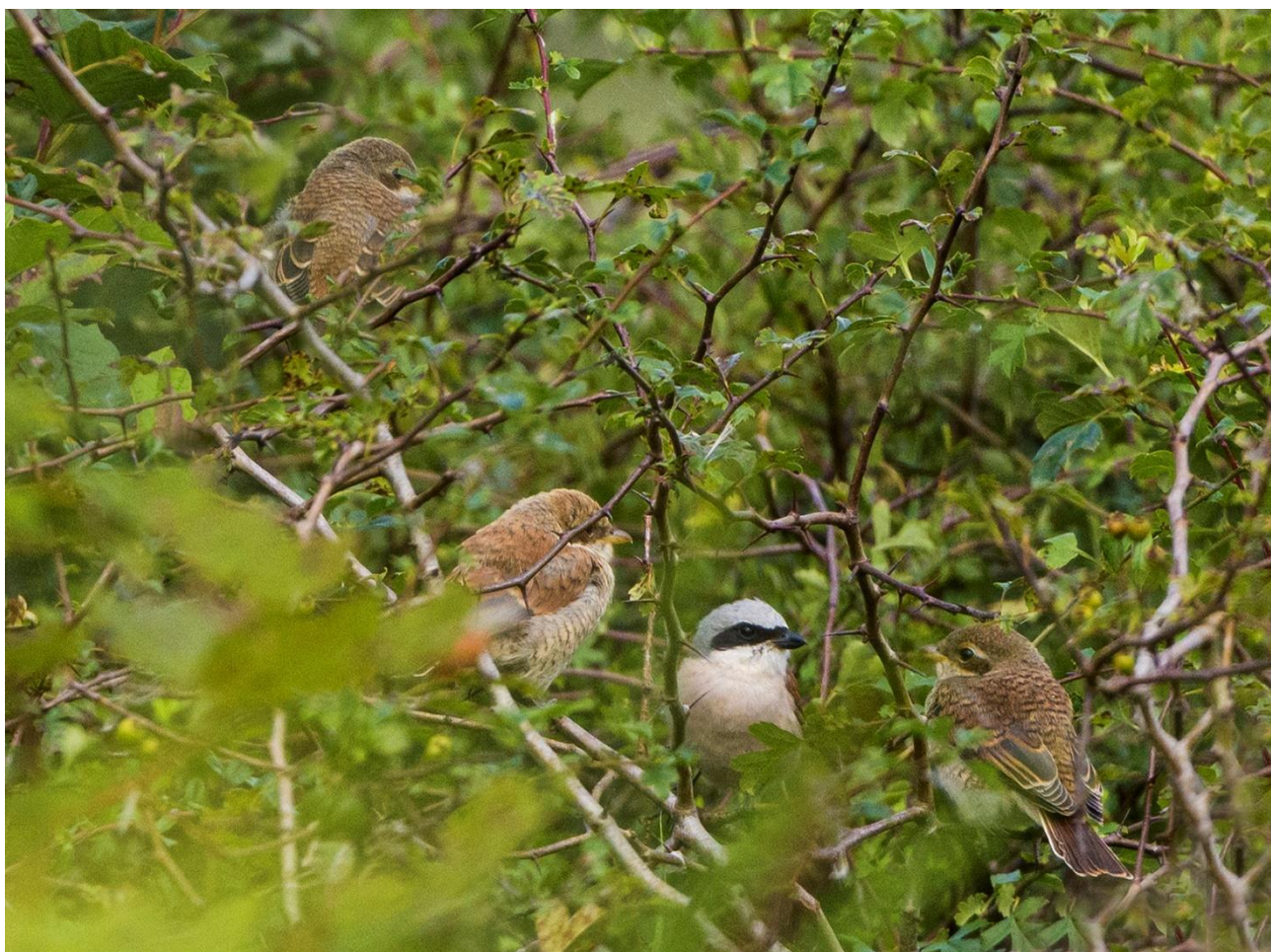
Mannetje grauwe klauwier met 3 jonge vogels

Samengesteld door P.J. Zomerdijk, Chr. van Orden, K. Zwart, W. Verkerk, B. Muusers, H. E. Fabritius en C. de Vries.