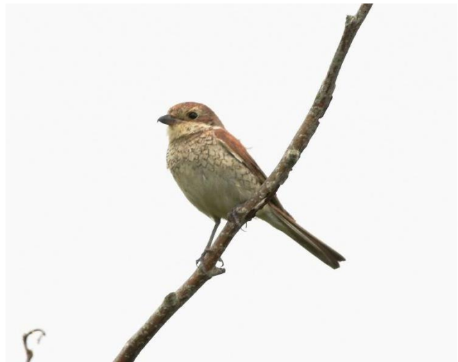
Vrouwetje grauwe klauwier in de Dijkgatsweide

Wieringermeer van 1939 tot en met 1962, wordt de grauwe klauwier als zeer zeldzame broedvogel benoemd. De soort is twee maal aangetroffen als broedvogel op De Terp bij Wieringerwerf in de genoemde periode. Met als noot dat er ook in 1959 en 1962 broedparen op De Terp aanwezig waren. In hetzelfde boekwerk valt o.a. het volgende te lezen over de Wieringermeer. In Robbenoord broedde de klauwier in 1937, 1939 en 1940 zelfs algemeen. Ook uit 1955 (Wieringerwerf) 1959 en 1961 zijn broedgevallen bekend uit de Wieringermeer, bron Dick Woets. Ook Wieringen wordt benoemd in deze uitgave. In 1947 waren er vermoedelijk twee broedgevallen op Wieringen, waaronder in een eendenkooi te Hippolytushoef. Het broeden op Wieringen was vanaf 1944 vastgesteld. Nu is het afwachten of de grauwe klauwier in 2022 terugkeert naar de Wieringermeer!