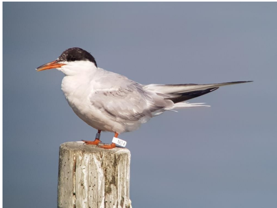
Visdief met witte vlag NO4 om poot

Een dag na de foto's van Lauwersoog stond er op wierhaven.waarneming.nl een foto van een steiger in het Regatta Centrum in Medemblik, bommetje vol visdieven. Wacht even. Dan moest ik daar ook maar eens met een telescoop naar toe!