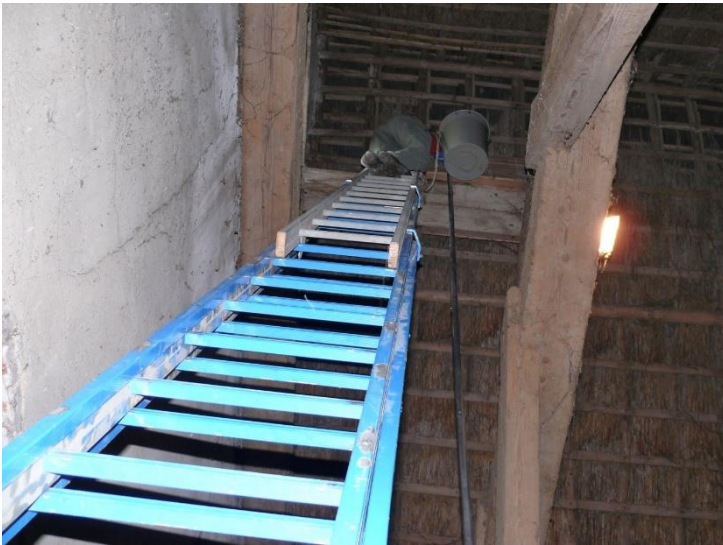
Luc Smit bovenaan een ladder in de nok van een schuur

machines. Elders werd gelukkig wel een nieuwe kast geplaatst op een beter bereikbare plek. De oude kast is na het uitvliegen van de jongen verwijderd omdat de houtrot had toegeslagen. Er werd een oude (privé) kast verplaatst en het invlieggat is aangepast op verzoek van de nieuwe bewoner. Een invlieggat bij een kast is tijdelijk afgesloten geweest in verband met overlast van kauwtjes in een schuur. Op een tweetal locaties zijn invlieggaten afgesloten en er is een kast weggehaald. Als kastencontroleur moet je geen last van hoogtevrees hebben want alle