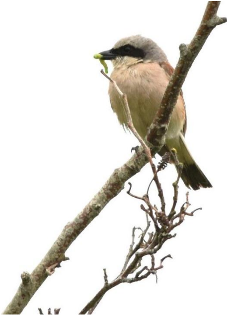
Mannetje grauwe klauwier

In het voorjaar van 2021 werden er meerdere waarnemingen gedaan van enkele grauwe klauwieren op verschillende plaatsen in de polder. Na een tijdje droogden de meldingen echter weer op. Totdat er eind mei opeens een zingend mannetje opdook op de Dijkgatsweide in de Wieringermeer. In dit artikel de beschrijving van een spectaculaire nieuwe broedvogel in het werkgebied van Wierhaven? Alhoewel nieuw?