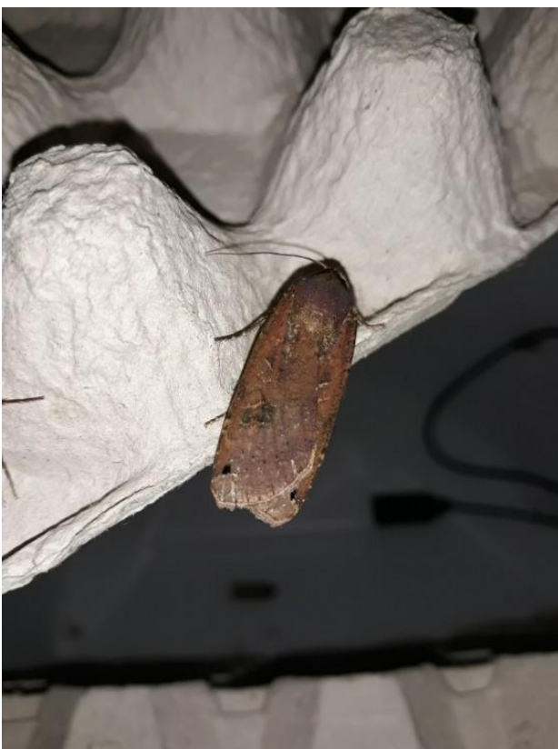
Vangst van een huismoeder Noctua pronuba in ledemmer

De eerste vangsten dateren van 27 juli toen onder andere de gamma-uil, puta-uil, v-dwergspanner en hommelnestmot werden aangetroffen in de emmer.