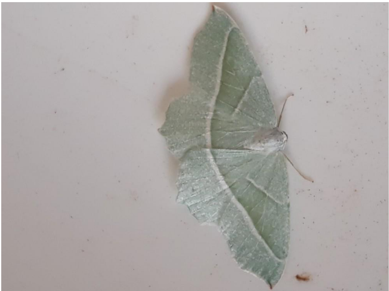
Een appeltak Campaea margaritaria , gevangen met behulp van de ledemmer

Ik kijk uit naar mijn volgende vangsten!