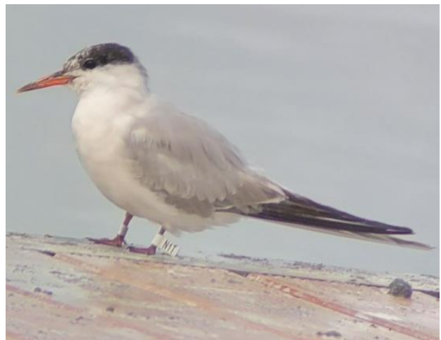
Visdief met witte vlag in Medemblik

Eén van de doelstellingen van de aanleg van de Marker Wadden is overigens, net als destijds van de Vooroever tussen Medemblik en Andijk, om de omstandigheden voor voortplanting en overleving van vissen gunstiger te maken. Eén ding is zeker: het aflezen van visdief ringen wordt door de ringers zeer gewaardeerd en levert de aflezer hele interessante informatie op. Daar ga ik volgend jaar zeker wat eerder mee beginnen, afhankelijk van het moment, waarop de vogels de steiger weer gaan gebruiken.