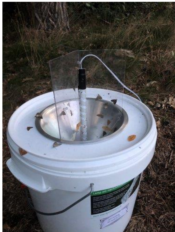
De nieuwe nachtvlinder lokemmer met LED-strip in het veld.

De emmer plaats je tegen de schemering en de volgende morgen pak je de vangemmer heel voorzichtig op om deze mee te nemen naar een plek waar je de emmer rustig kunt openen en de vlinders kunt determineren.