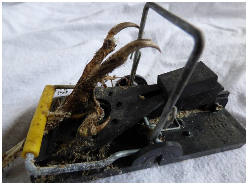
Een poot van een kerkuil in een muizenval