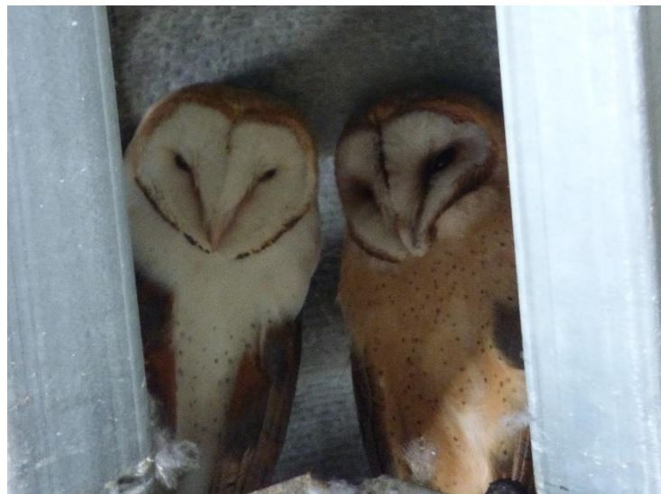
Een paartje kerkuil in de nok van een schuur

In 2020 raakten er zeker 15 kasten bezet door een paartje. Twee broedparen zaten op een natuurlijke nestplaats, wat niet alle jaren voorkomt. Dat leidde tot een totaal van 17 broedparen voor het gebied. Van de eerste broedsels is er maar één mislukt, dat ging dus prima. In totaal werden er 133 eieren gelegd. Er vlogen uiteindelijk 66 jonge uilen succesvol uit dit seizoen, waarvan er 11 niet geringd raakten. Dit omdat het natuurlijke nestplaatsen betreft waar we niet bij kunnen komen. De beide tweede broedsels met in totaal 11 eieren zijn echter helaas mislukt. Vijf vogels werden dood gevonden, waarvan er drie geringd waren. Het was een vrij matig broedseizoen voor de kerkuilen in de Noordkop.