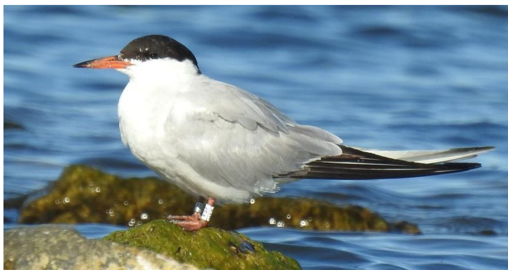
Visdief met witte kleurring