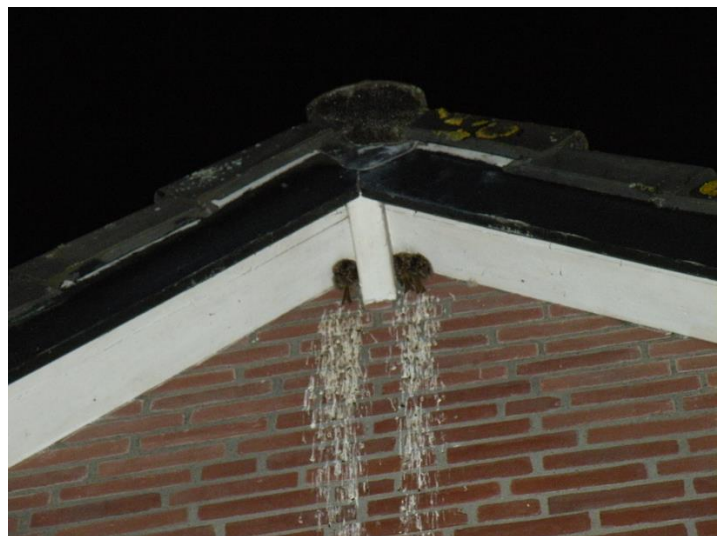
Slapende boomkruipers onder de nok van een huis in Bergen

Dinsdagavond 18 januari gaat oud biologieleraar Dook Vlucht uit Bergen een digitale presentatie voor Wierhaven verzorgen over de onbekende wereld van de boomkruipers. Dook volgt al een drietal jaren intensief deze vogels in zijn directe omgeving en telt ze daarbij op centrale slaapplekken aan huizen. Een fenomeen wat zich heeft ontwikkeld en inmiddels heeft hij ook ontdekt waar en hoe er gebroed wordt. Boomkruipers zijn wat geheimzinnige vogels waar nog heel veel aan te ontdekken is en over te vertellen valt. Aanmelden voor het bijwonen van deze presentatie kan tot 17 januari via: educatie@wierhaven.nl .