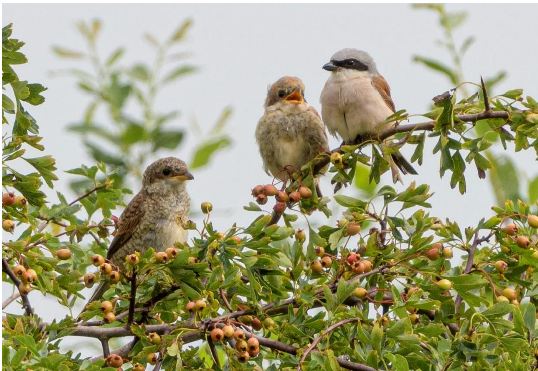
Mannetje grauwe klauwier met 2 jonge vogels in de Dijkgatsweide

Gelukkig heb ik vele jaren ervaring opgedaan in Dwingeloo in Drenthe, waar tal van broedparen te vinden zijn. Maar de Dijkgatsweide is toch wel even iets anders dan het Dwingelderveld, waar de soort veel in braamstruweel met bosjes is te vinden. Braamstruweel met meidoorn bosjes heeft de Dijkgatsweide deels ook en dat was precies het biotoop waar dit paartje zich ophield. Hoewel tussen beide struwelen een fietspad loopt, was deze drukte niet van invloed op het paartje. In de weekenden waren de vogels wel eens wat minder opvallend aanwezig. Maar al met al ging het qua verstoring goed. Naarmate de tijd verstreek was het paartje nog steeds aanwezig begin augustus en werd het vrouwtje minder gezien en was het mannetje actief. Het zou toch niet zo zijn hé, was mijn gedachte gezien het feit dat deze soort tot in augustus nog jongen kan voortbrengen. Toen ik op 7 augustus langs het fietspad naar insecten op de schermbloemen wilde gaan kijken, begon het vrouwtje ineens heftig te alarmeren... Bingo, dit doet zij niet voor niets dus dacht ik.