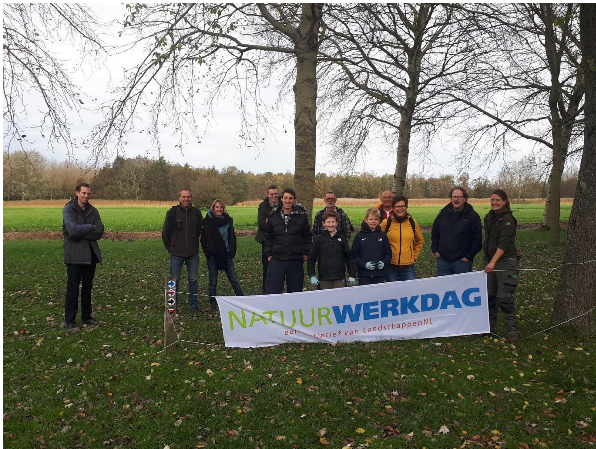
Deelnemers aan de Natuurwerkdag 2021 in het Dijkgatbos

De klusgroep van de natuurvereniging Wierhaven bestaat uit vijf mensen die regelmatig onderhoudswerk verrichten als vrijwilliger bij Staatsbosbeheer. Daarnaast wordt de oeverwaluwand bij de Zuiderhaven onderhouden, worden er nestkasten getimmerd en andere kleine onderhoudsklussen in de natuur verricht. De groep is aangesloten bij Landschap Noord-Holland, waar allerlei materiaal voor onderhoud kan worden geleend en cursussen kunnen worden gevolgd aangaande het werken in de natuur. Staatsbosbeheer gaat in 2022 kijken of er mogelijkheden zijn om de vrijwilligersgroep uit te breiden. Heb je interesse om ook vrijwilliger te worden? Stuur dan een e-mail naar Mikal Folkertsma, boswachter bij Staatsbosbeheer: m.folkertsma@staatsbosbeheer.nl .